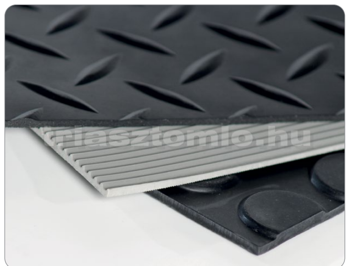
Mintás felületű gumilemezek