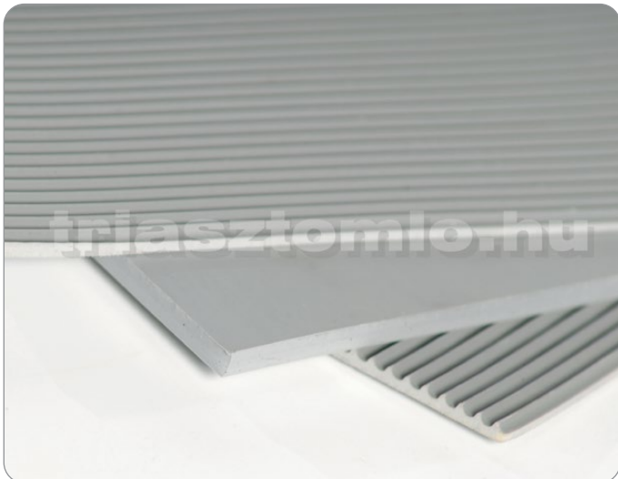
Elektromosan szigetelő gumilemezek